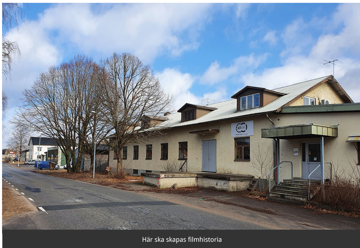
Här ska skapas filmhistoria